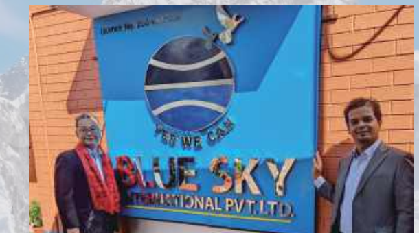
ネパール本社ビル(カトマンス)

BLUE SKY INTERNATIONAL は、ネパール国内で最大級の実績を誇る送り出し機関です。これまで中東やヨーロッパを中心に10万人以上の人材を送り出してきました。今般、LOOK EAST というスローガンを掲げ、特定技能人材育成を中心に、さまざまな分野において年間1,000人以上のネパール人材の送り出しを行なってまいります。